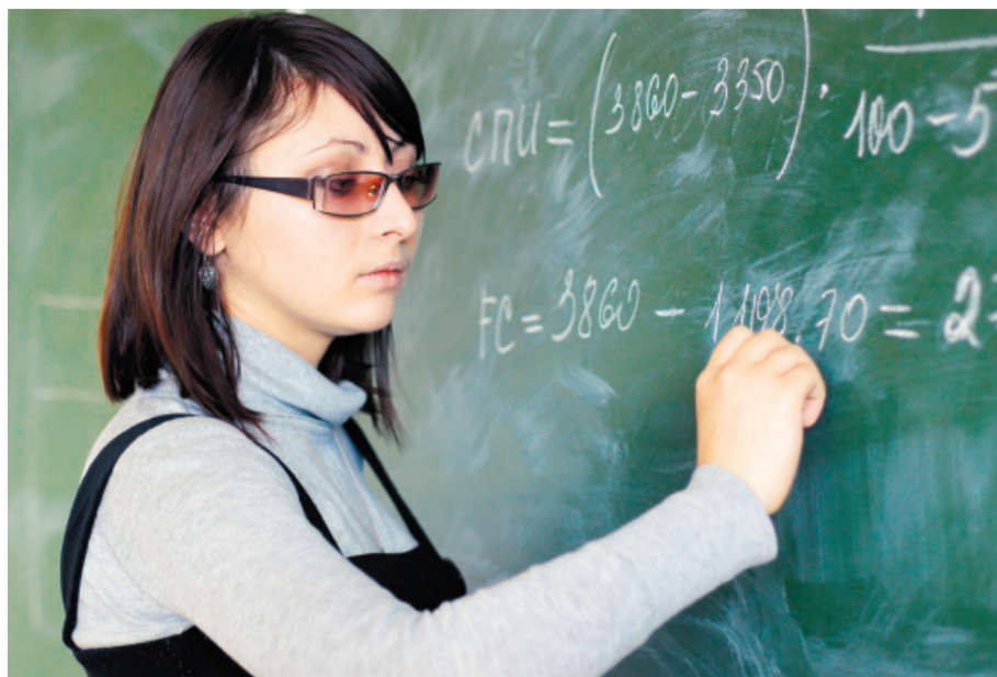
THE-QS World University Ranking, nebo CHE Excellence Ranking? Evropa se kloní k CHE.

V žebříčku Excellence Ranking Centra pro rozvoj vysokého školství CHE (viz tabulku) se nejúspěšnější evropské země řadí podle počtu škol umístěných v CHE, tedy těch, které mají podle rozboru CHE vysoké školy s excelentními pracovními ve zkoumaných oborech. V tabulce je uveden rovněž počet hvězdiček, jimiž CHE excelentní pracoviště hodnotí mimo jiné na základě výsledků publikační činnosti, citovanosti, mobility nebo speciálního institucionálního