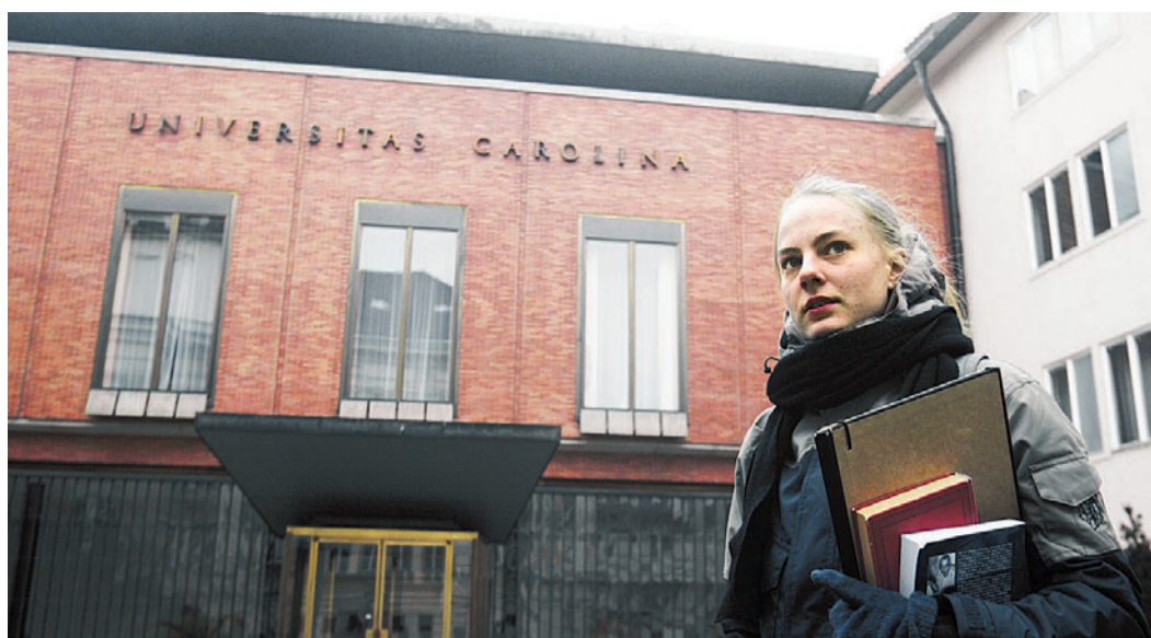
Filozofická fakulta Univerzity Karlovy, nebo Filozofická fakulta Masarykovy univerzity? Stále nejtěžší je dostat se na pražskou filozofii, nejvíc studentů zase berou do Brna.