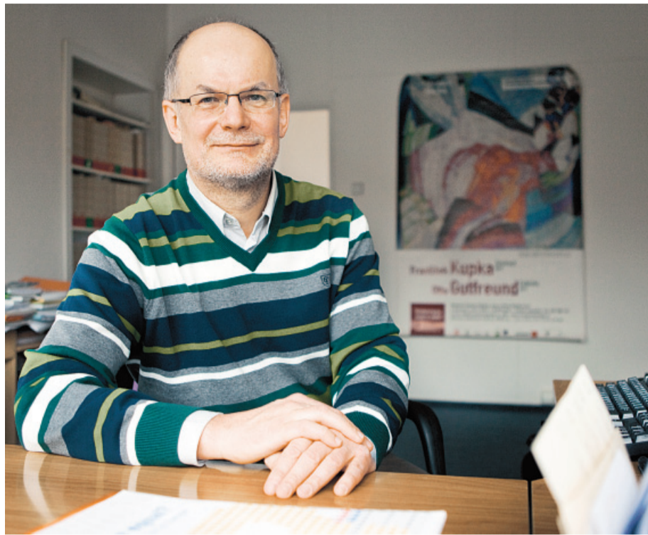
Do roka možná bude i srovnání s Evropou. Práce na typologii českých vysokých škol nekončí.

Rozumí se tím například zaměření vysoké školy na regionální problematiku nebo na studenty z daného regionu. Školy dostávají „regionální body“ například podle podílu prostředků získaných od územně samosprávných celků a podílu studentů, kteří mají trvalé bydliště ve stejném kraji.